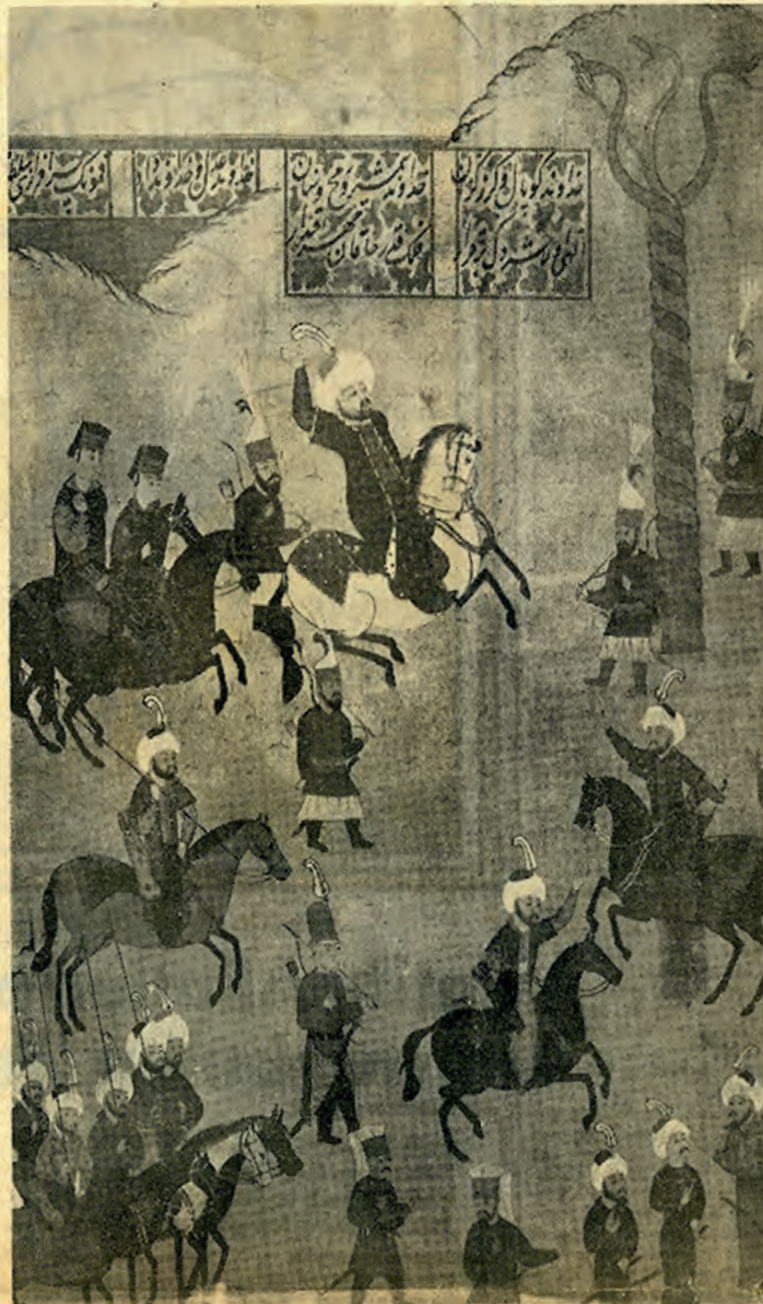
Hünernameden bir sayfa:

Fatih Sultan Mehmet, İstanbulu almış bir gün şehirde dolayışken mahzen gibi bir yerde bir iniltili duyarlar. Adamları oraya gider, perişan vaziyette iki papaz ile karşılaşılır. Hapsedilmeleri